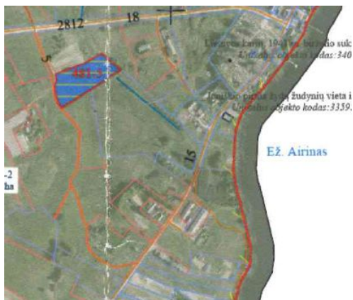
1 pav. Jonišio kadastro vietovės žemės reformos žemėtvarkos projekto ištrauka, nuomai suprojektuotas žemės ūkio paskirties sklypas proj. Nr. 481-5

Žemės sklypas suformuotas Jonišio kadastro vietovės žemės reformos žemėtvarkos projekte, patvirtintame Nacionalinės žemės tarnybos prie Žemės ūkio ministerijos Molėtų skyriaus vedėjo 2023 m. spalio 31 d. įsakymu Nr. 40VĮ-788-(14.40.2.) „Dėl Utenos apskrities Molėtų rajono (savivaldybės) Jonišio seniūnijos Jonišio kadastro vietovės žemės reformos žemėtvarkos projekto patvirtinimo“. Pagal asmenų, kuriems projekte suprojektuoti žemės sklypai, Jonišio k. v., patvirtintą sąrašą pareiškėjui suprojektuotas nuomai žemės sklypas, projektinis Nr. 481-5 (žiūrėti 1 pav.)